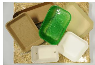
Verpackungsschalen aus nachwachsenden Rohstoffen, Quelle: Dr. Imke Korte