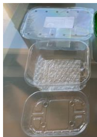
Fossilbasierte Verpackungsschalen